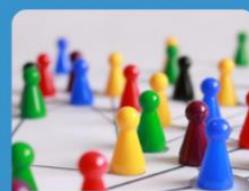
Outil de matching